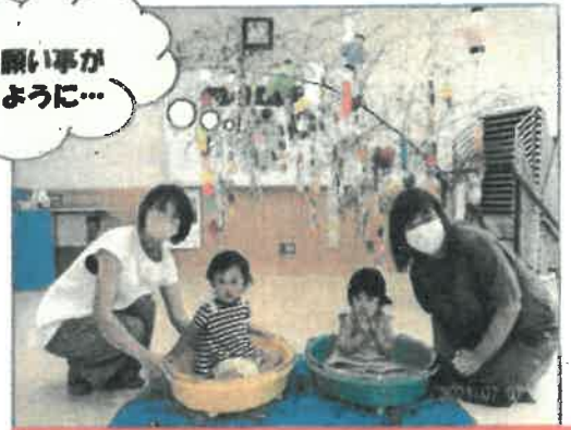
7/7 ひまわりクラブ「七夕集会」 大和公民館にて ゲームやバルーンもして楽しみました。