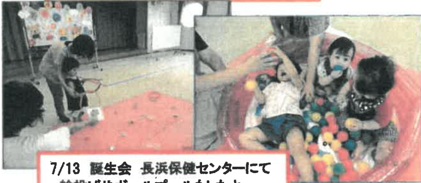
7/13 誕生会 長浜保健センターにて 輪投げやボールプールもしたよ