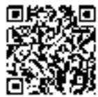
松山東高等 学校(通信制) ホームページ

松山東高等学校通信制課程 ☎089(945)0131 https://matsuyamahighashi-h-c.esneted.jp/