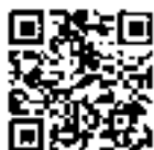
ポリテクセンター 愛媛ホームページ