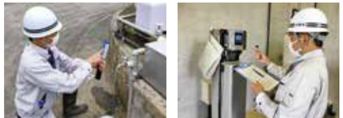
水道の安全を守るため、検査点検を実施しています