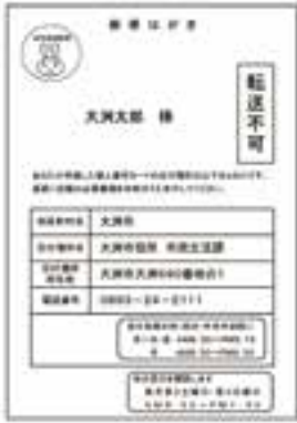
交付通知書（はがき）