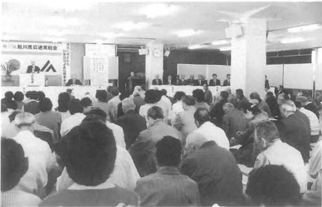
あいさつをする鉾岩組合長

去る四月二十八日、肱川町公民館に於いて第四十九回 J A 肱川通常総会が開催された。