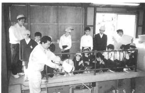
中野小学校の4年生が中央水源地を見学

湧水洞から出てくる水がろ過地を通り滅菌消毒して安全な水ができること、また水源地の井戸をのぞいたり、ポンプ室に入りここからポンプによって家まで水が送られてくること等を水道係の職員から説明を受け熱心にメモをとっていました。