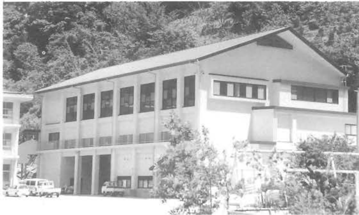
新築された中野小学校屋内運動場