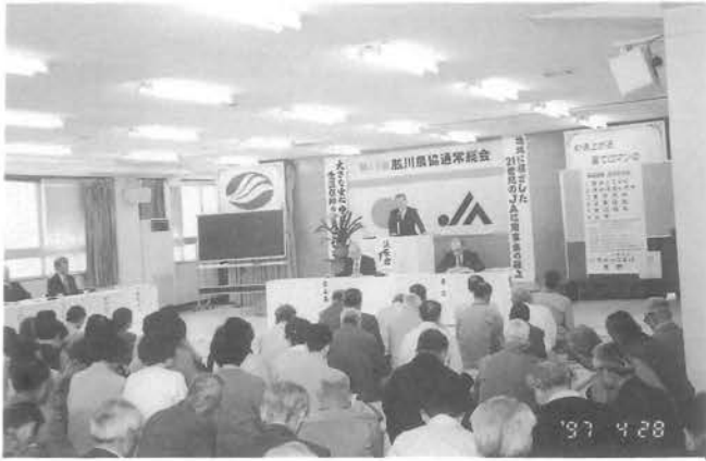
祝辞をのべる大野町長