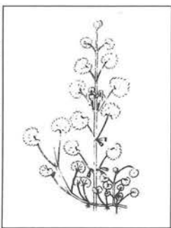
カキドオシ(シソ科)

4〜5月ごろ、薄紫色の唇形花をつける多年草。葉はほぼ円形で茎に対生し、花が終わると、茎は土をはうように伸び、垣根を通り越してよそに侵入するので、垣通しの名がついたといわれます。