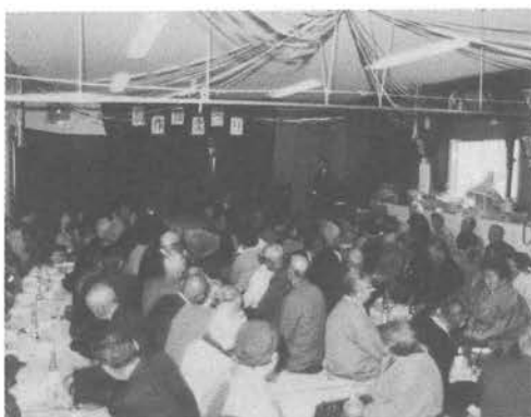
創作まつりで楽しいひとときを過ごすお年寄り