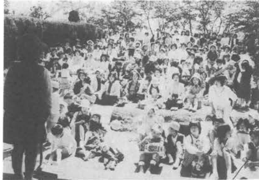
得意の歌を披露する豆スタ―たち

のど自慢大会のあとはもちまきを行って、五月晴れの楽しい一日を過ごしました。 なお、当日の入賞者は次のとおりです。