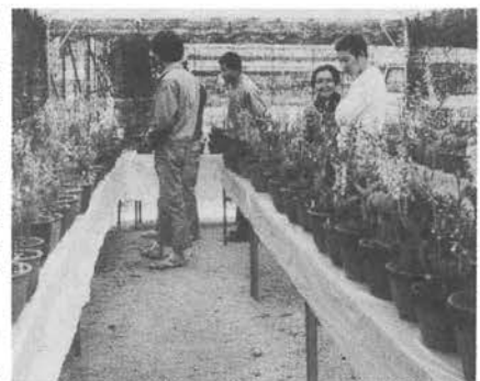
愛好家でにぎわう展示会場

鹿野川花まつり期間中の四月二十八日から三十日の三日間、肱川エビネ愛好会によるエビネの展示、即売会が肱川分校跡地で行われました。