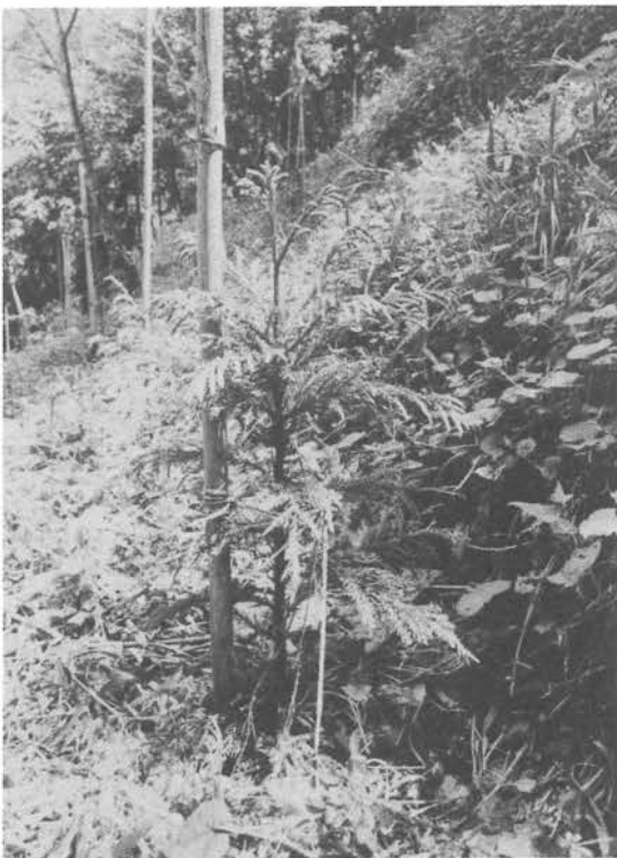
(雪起こしをしたスギ造林地) 優良材生産は直材づくりから!