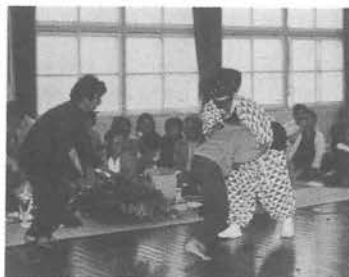
ダイバンに負けるな

午後は、小学校の講堂で県指定文化財の「しめ神楽」の公演がありました。「だいはん」が出てきた