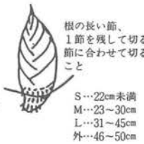
II. タケノコの調整方法