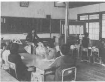
予子林小学校の 複式授業風景

私たちの身近なPTAや愛護班活動で考えてみたい問題がたくさんあるようです。みんなが協力し合っていい子供達、いい地域づくりを進めていきましょう。