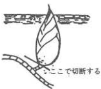
I. タケノコの掘取方法