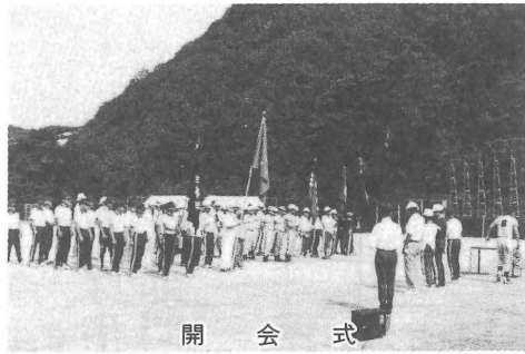
開 会 式

当町は、議員の奥さん達もかけつけ、敵味方の別なく応援し、遠来の参加議員も大喜びでした。