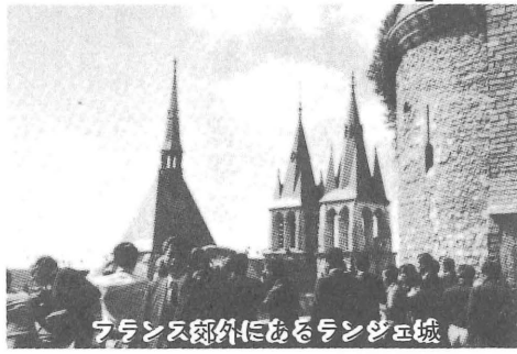
フランス郊外にあるランジュエ城