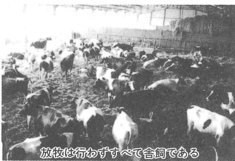
放牧は行わずすべて舎飼である

の構成員は、七人の常備を雇用しており、さらに八人の婦人が働いていたので、これは一九労働単位に等しいものであった。今日では、同じ作業量を八人の構成員と二人の常備(一〇労働単位)で行っている。これでもなお、その経営面積に比すれば労働力は多いように思えるが、労働力は半分に減少したのである。