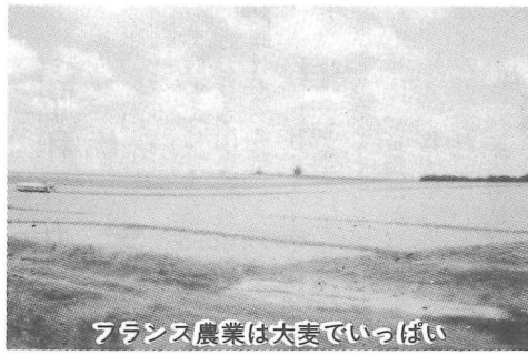
フランス農業は大麦でいっぱい