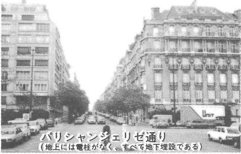
パリシャンゼリゼ通り (地上には電柱がなく、すべて地下埋設である)