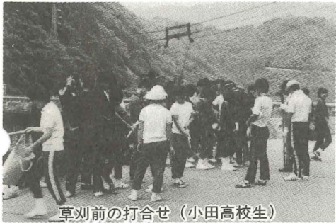
草刈前の打合せ (小田高校生)

に次々と移植されました。 移植されたサルビアは、現在肱川中学校と肱川分校で水やりや施肥の管理をしており、本番には真っ赤な花が会場周辺に採りを添えてくれることでしょう。 また、大洲農校では、六月二一日に園芸部や生徒会役員が、大洲市内三カ所で一、五〇〇本のペチュニアの苗などを、総体成功を呼びかけるバンフレットとともに買い物客や通行人らに配りました。 この他、小田高校生、肱川分校生、肱川中学生の協力により、ダム周辺の草かりや清掃作業等も行われました。 今大会が成功するようみなさん