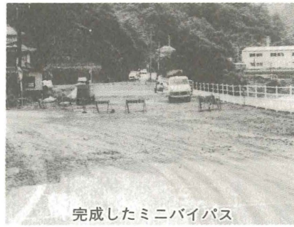
完成したミニバイパス

肱川町を縦貫する国道一九七号線は、地域の動脈として、その役目を果しておりませんが、大型化と共に増加する「くるま社会」の今日、滝山附近は、日夜、交