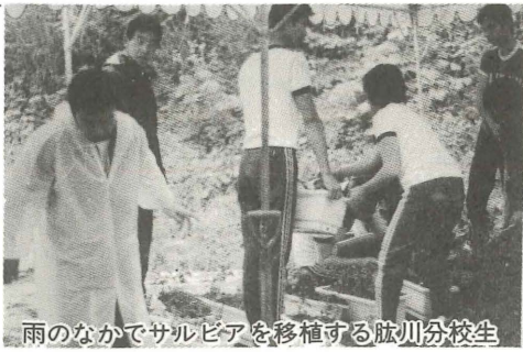
雨のなかでサルビアを移植する肱川分校生

55総体まであと一日となり、肱川町ではその準備も大詰めをむかえています。 当町では、一昨年から総務企画、競技、施設、宿泊接待、衛生、交通警備、町民運動の七つの部を設けて、歓迎講習会、施設、宿泊ガイドマップの印刷、宿舍割当、設備の整備、献立講習会、野犬の補獲……などを、それぞれが分担して進めてきました。 特に町民運動部では、六月二〇日に、大洲農校生らが育てたサルビアの移植作業を行いました。この日は、あいにくの雨でしたが、肱川分校生二七人の協力を得て、五〇〇個のプランター