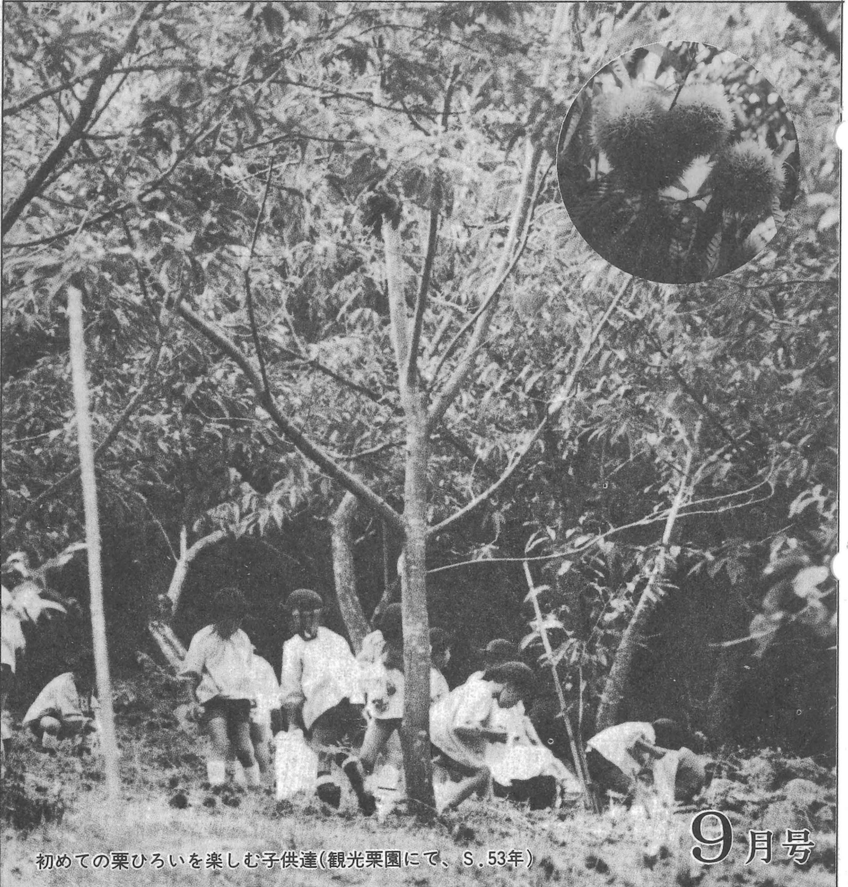
初めての栗ひろいを楽しむ子供達(観光栗園にて、S.53年)