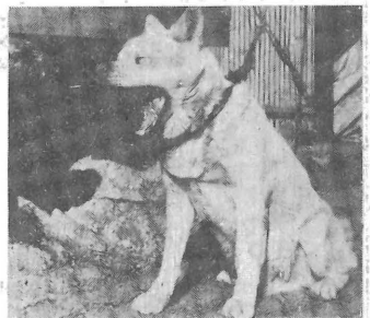
犬はつないで飼いましょう

事故原因のほとんどは、飼いのしつけ、訓練が不十分だからです。 その結果、スト、スのはけ口