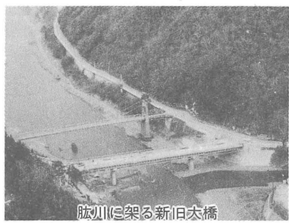
肱川に架る新旧大橋

全を祈願。中野小児童たちも、鼓笛パレードや旗行列で開通を祝う。(3/26)鹿野川大橋竣工式