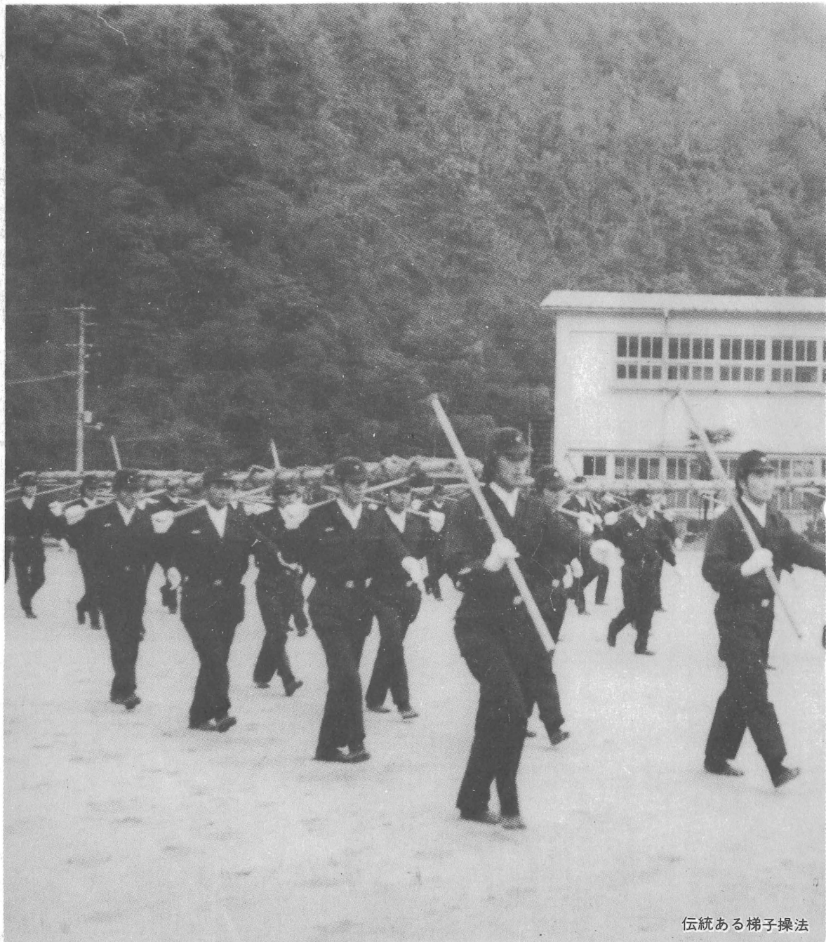
伝統ある梯子操法