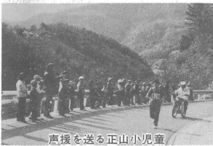
声援を送る正山小児童

○「これはやれん、口をつけんといけんのか」消防団の猛者もさすがにタジタジ。水の季節を迎え、事故のないよう祈りつつ、口うつし人工呼吸法を受講。(2/26)日赤救急看護講習会