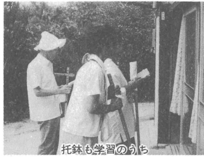
托鉢も学習のうち

所を元気に巡拝して卒業。土佐窪川では、農家の玄関に立ち、胸をどきどきさせ、生れて初めてお遍路托鉢を実習。(水)高知を最後に