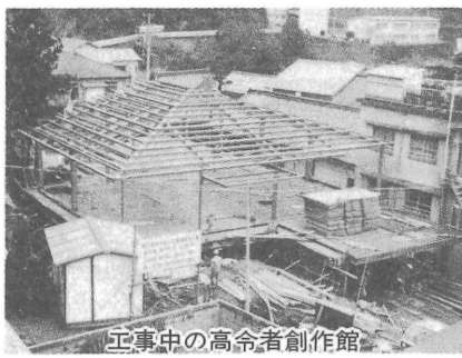
高令者創作館の施工中

○「八〇年代に向けての県政の担い手を決める県知事選挙」といわれたが、低調ムード。史上最低の投票率を記録。(水)県知事選挙