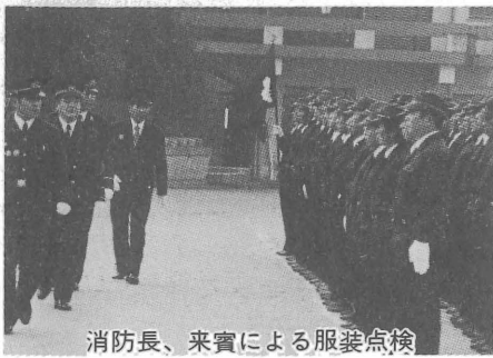
消防長、来賓による服装点検