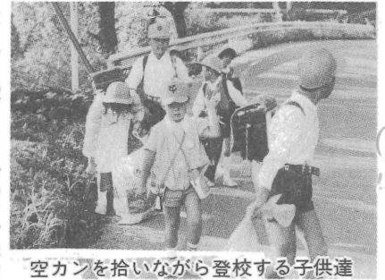
空カンを拾いながら登校する子供達