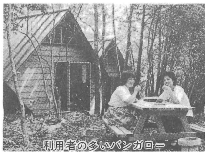
利用者の多いバンガロー

テント、バンガロー、炊事施設も完備。夏季には、野外教育、研修に申込殺到。(5/16)開所式