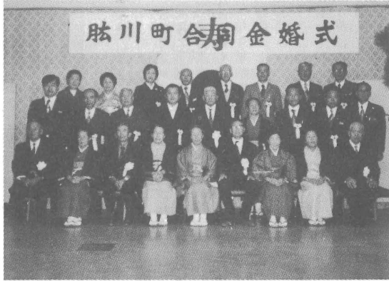
式の後会場で記念撮影