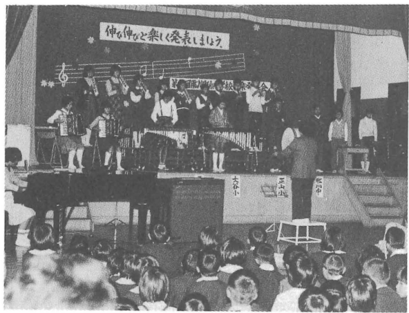
日ごろの練習成果を発表(中野小)

かな灯を、いつまでも絶やすことなく、より良い会場で、より良い演奏ができることを念じています。