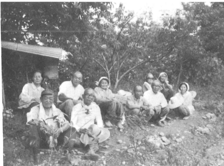
花本栽培に「生きがい」を感じて... 正山老人クラブの皆さん。

このうち、国保加入者に係る昭和五十年度の医療費総額は、五千五百一十円で、一人当り一萬六千八百円である。