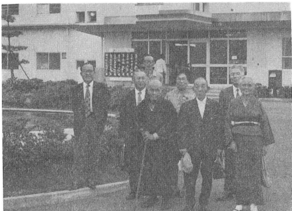
保養センターへご招待 町出身の老人ホームのみなさん

十月の議員協議会にする。「町道滝山～白石線の改良について」 県が三千万円で改良工事を行なう。今年度はインフラ対策による公共事業繰延べのため千五百万円分を行なう。用地については完了。 「救急車の設置について」従来の患者輸送車を改良救急車とする。 「県道舗装について」 県へ要望していたが「松川町は他町村に比べ舗装が多いので本年度は栗太郎・赤岩間のみの見込である」「国鉄バス内子～野村線の開設について」 内子町が発起となり、期成同盟会ができた。国鉄内山線が五十年完成の予定である。内子駅が急行停車駅となるので内子町へ出るの便利になる。 先般関係町村長が上京、国鉄、国へ陳情した。競合路線の伊予鉄との関係、道路の改良によって開通の見込みがある。 「県道蔵川～大谷線の改良について」 昭和四十七年度の県道昇格の条件として、ブルドーザーにより道路をつけたが一部未改良部分があったが地主との用地交渉ができたので二九〇万円を急拠工事を行なうこととした。 一般質問は紙面の都合で省略