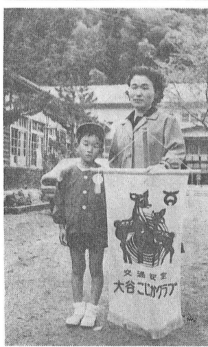
クラブ旗を手にしたお母さんと保育園児

母子ぐるみで交通安全ルールを身につけ、子どもを交通事故から守るとともに、交通安全思想を高めようとするのは、今までのことと変わらぬこととなります。 支所取扱いは、毎月二十七日から三十日までとし、他は本所へ納付してください(岩谷地区は、二十八日の午前中に農協職員が、岩谷小学校まで出張します。) 個人分は、納入通知書持参者だけ取扱います。納入通知書のない人、月例の町税以外のものは本所または役場へ持参してください。 一般支払を請求される方に請求は今までどおり提出してください。支払いは普通収入役が小切手を発行します。 農協の口座払を希望される場合は、請求の時、その補助金等は直接収入役より現金で支払うものについては、その都度通知をします。