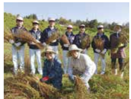
一回目は長浜高等学校からです。