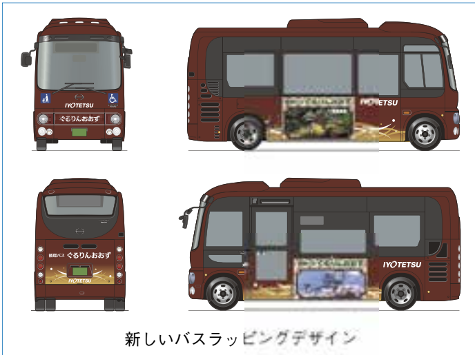
新しいバスラッピングデザイン