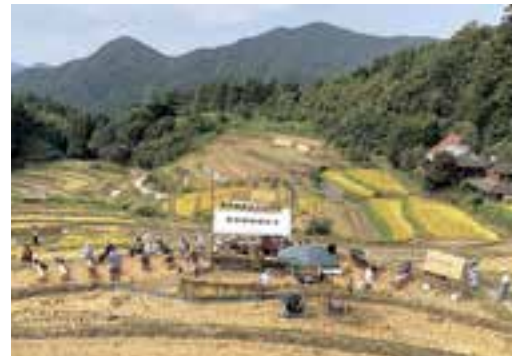
令和元年度大洲市がんばるひと応援事業採択事業「戒川地区榎谷の棚田保全事業」

事業計画書、収支予算書、その他参考資料（支出の根拠となる見積書など）を担当課へ提出してください。