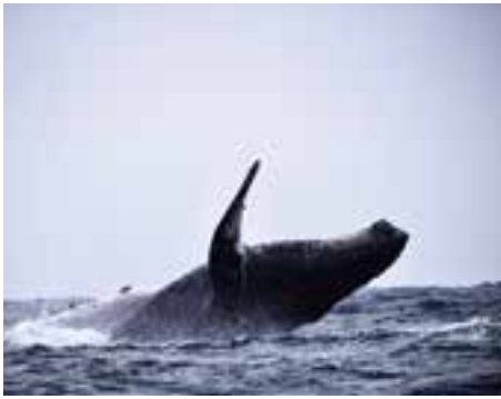
ザトウクジラ 出産のために6～9月にかけて移動してきます。

エクアドルには、海岸、山岳、アマゾン、ガラパゴス諸島の4つの地域区分があります。海岸地域には、野生のイグアナやイルカがいます。また、6～9月にかけてザトウクジラを見ることができ、山岳地域にはアルパカやリヤマ、アマゾン地域にはオオハシなどの珍しい鳥がたくさんいます。放牧も盛んに行われていて、田舎道を移動していると、牛や馬、ヤギなどの動物が道路を横断している光景をよく見かけます。