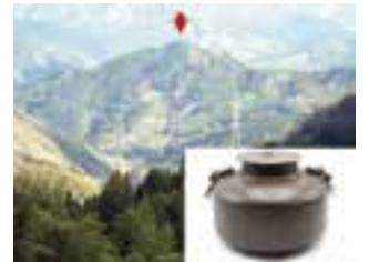
高尾城跡と採集された茶釜

高尾城跡は、鹿野川ダム湖の西側、西予市野村町に接する高雄山の山頂(標高約389m)に位置します。