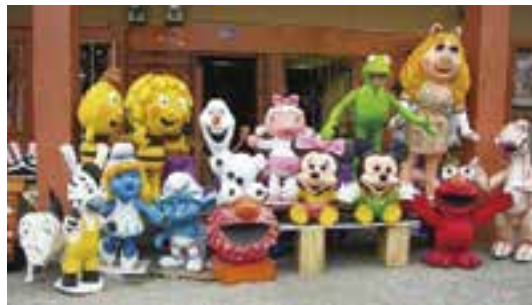
年始に燃やす人形「モニゴテ」(monigote) たち 中には5mを超えるものもあります。

気づけば任期も残り10カ月となりました。悔いの残らないよう最後まで楽しみたいと思います。それでは、また次回。 「Hasta luego! (スペイン語で「またね」の意味)」