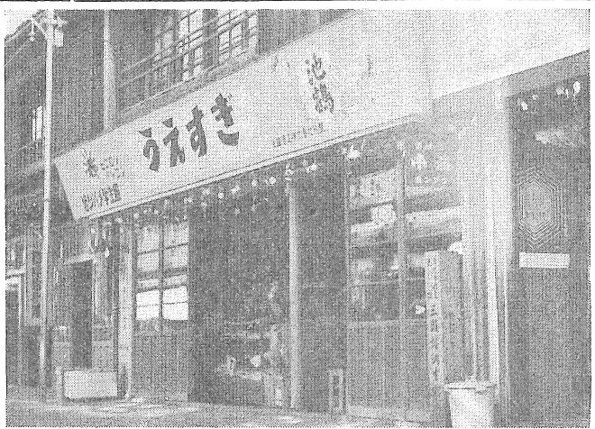
中町一丁目の諸瀨生家