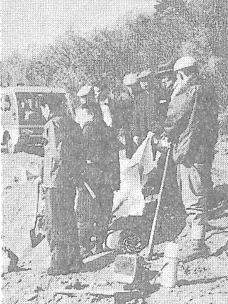
植樹の前に打ちあわせる会員ら

税金を余分に納めてしまったような場合は「更正の請求」の手続きをして、余分に取られた税金を返してもらうことができます。