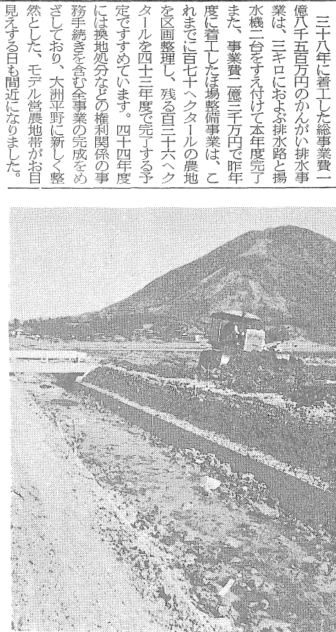
ブルでピッチあげる大洲平野の土地改良事業