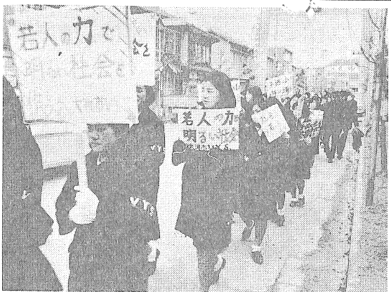
市VYS会員ら70人による環境整備などを訴える市中パレード

すめています。 これまで本市の学校給食は、大洲、新台、菅田の三学校給食共同調理場と平野小・中、蔵川小・中の単独調理場のあわせて五か所で調理し、市内全校の給食運営にあたり、近ごろの児童生徒数の漸減に伴い小規模校になる平野、蔵川両地区の給食は、集団給食によるより効果的な運営を図ると、先般平野地区と市教育委員会の話し合いを進めてきた結果、四月から施設設備の充実した大洲、菅田の各学校給食共同調理場へ統合することにきめたものです。 これにより市内小・中学校二十七校と幼稚園五園の完全給食は大洲、新台、菅田の三学校給食共同調理場で調理し、各学校へ配達することにになりました。なお、本市尾和副団長が列席し、晴れの受