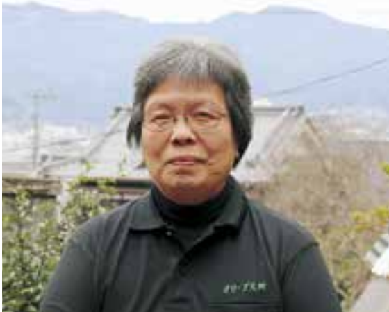
要約筆記サークル「オリーブ大洲」