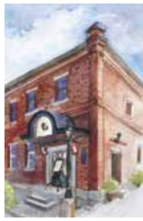
【高・大・一般の部最優秀賞】 「威風堂々」