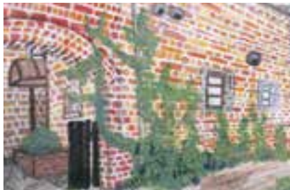
【中学生の部最優秀賞】「ある夏の午後」