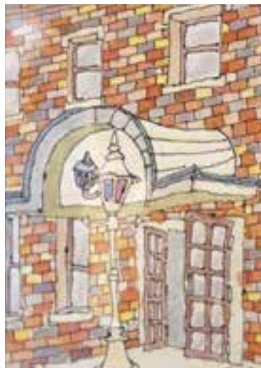
【山田きよ賞】「たたずむレンガ館」