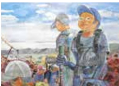
作品名「富士山の頂上を目指して」