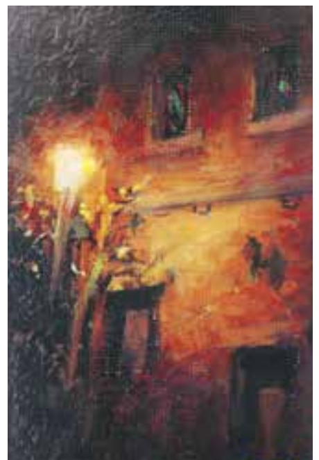
【大洲市長賞】「灯りがともる」