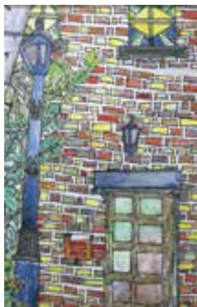
【小学生高学年の部最優秀賞】 「赤レンガ館」