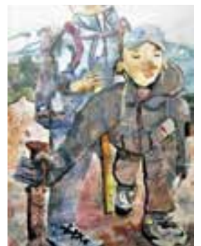
作品名 「がんばったよ。富士登山」

平成29年度土砂災害防止に関する 作品コンクール 小学生・絵画の部 優秀賞「国土交通事務次官賞」