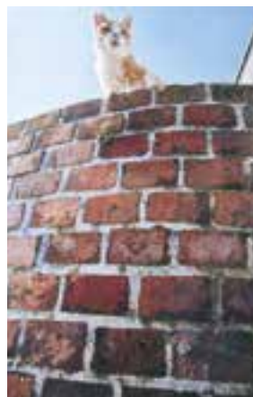
【写真の部最優秀賞】 「赤レンガと猫」