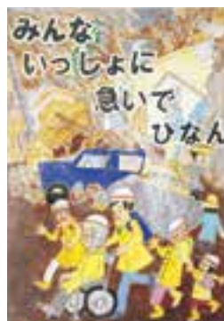
作品名 「みんないっしょに急いでひなん」

2017年「ふるさとのお盆の思い出」 絵画コンクール 小学校・高学年の部 「優秀賞」