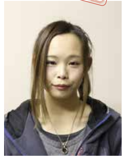
インテリアクナガ (徳森1489-1 ☎25-3256)