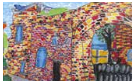
【小学生低学年の部最優秀賞】 「おおず赤れんが館」