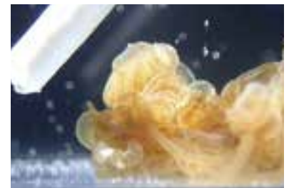
竹串には水族館部作成のクリームが塗られていて、クラゲの触手に当たっても絡まない。

静岡県に本社のある株式会社A B Sの全面的なバックアップのもと、5つの試作品を仕上げてきました。クラゲ予防の効果も発揮されるのは、マグネシウムがイオンとして溶けている時です。クリーム中の水と油が分離するのを防ぎつつ、効果が発揮されるよう成分の配合を調整したり、混ぜる順番を変更したりしてきました。今後は、この試作品の改良を続け、強い毒性を持つ別のクラゲに対しても効果が発揮されるかを確かめ