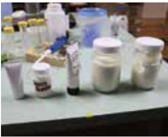
左から順に試作されたクリーム。

静岡県に本社のある株式会社A B Sの全面的なバックアップのもと、5つの試作品を仕上げてきました。クラゲ予防の効果も発揮されるのは、マグネシウムがイオンとして溶けている時です。クリーム中の水と油が分離するのを防ぎつつ、効果が発揮されるよう成分の配合を調整したり、混ぜる順番を変更したりしてきました。今後は、この試作品の改良を続け、強い毒性を持つ別のクラゲに対しても効果が発揮されるかを確かめ