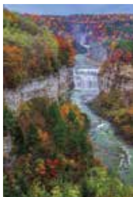
レッチワース州立公園

私は5年間、大洲で多くの自然を探索してきました。その中で、大洲の自然の美しさを愛している人たちに会うことができました。数カ月後の帰国のために準備していると、この美しい場所を離れることに寂しさを感じます。大洲の自然だけでなく、大洲に住むみなさんの心も、同様に美しく豊かだと思っています。私は、ALTとして大洲でたくさんの人に出会えたことに感謝しています。