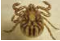
キチマダニ（吸血前）

森林や草地などの屋外に生息する比較的大型（吸血前3〜8ミリ、吸血後10〜20ミリ）のマダニです。食品や衣類などに発生する、家庭にいるマダニとは全く種類が異なります。