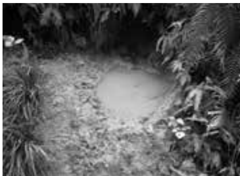
イノシシのヌタ場（泥を浴びる場所）

地域全体がひとつになって対策を行うことで、野生鳥獣と共生・共存できる地域を目指しましょう。