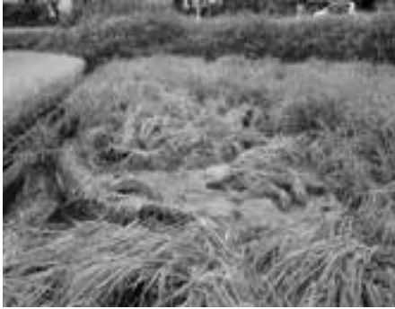
イノシシによる水稻被害

今年度は、市民のみなさんからの相談件数が多く、特に7月から9月は各月20件を超える農作物や生活環境被害の報告が寄せられています。被害状況などの確認を行い、猟友会や関係機関と連携し、有害鳥獣対策に取り組んでいます。