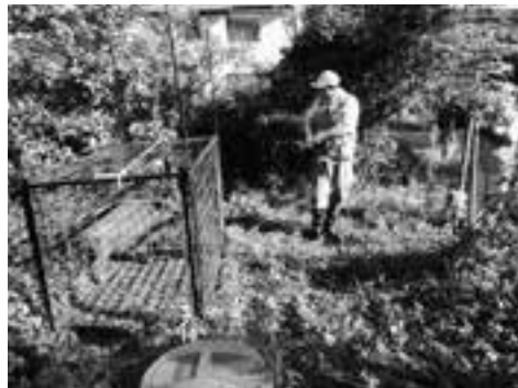
猟友会によるイノシシ捕獲

10月に大洲高等学校付近で、体長1mを超えるイノシシが農地や住宅地に昼夜問わず出没しましたが、猟友会や警察、地域のみなさんと連携し、箱わなでイノシシを捕獲することができました。今回の捕獲事例は、箱わな設置のための土地利用への理解、イノシシ出没時の連絡協力によるものです。他地域においても、連携や協力により確実に捕獲実績が上がっています。