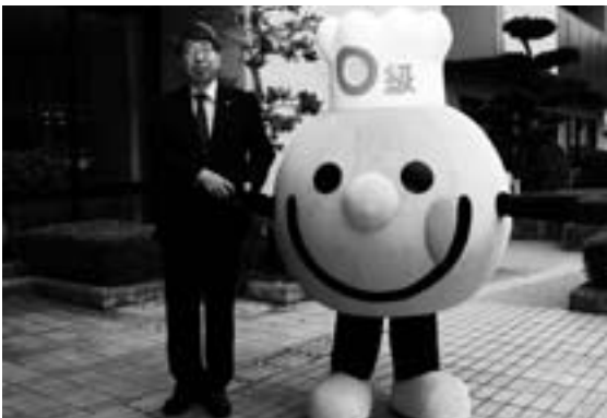
清水市長と0級くん