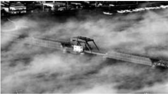
H23【推薦】赤橋をつつむ朝霧