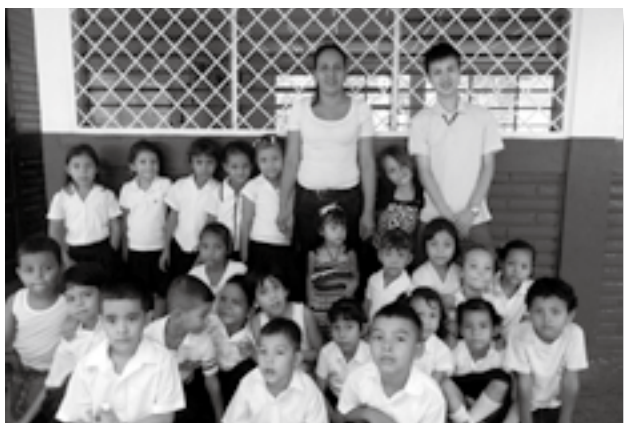
1年生の子どもたちと

学校での活動、友達や近所の人との雑談。こうしたニカラグアでの日常が本当に楽しいです。1日1日を大切にしながら活動していきたいと思えます。