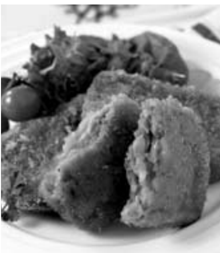
じゃこカツ 【株シロモト食品】 ～愛媛県産の地魚をすり潰しまるごとカツに～

「じゃこカツ」は、給食でも食べたことがあります。 外側がサクサクで、中はホクホクしてて、今まで食べたことのない食感でした。とても食べやすく、おいしかったです。 材料が小魚だと知って驚きました。 また、家族みんなで食べてみたいです。