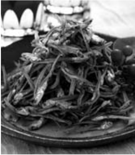
いわし黒酢南蛮【宥竹内海産物】 ～新感覚の食べるいりこ～

食感は、従来の同じような商品と比較しても軟らかい感じでした。少し甘目の味付けで、子どもからお年寄りまで、幅広い年齢層で受け入れられる商品だと思います。 私はお酒をたしなみますが、お酒のさかなというよりも、ごはんのおかずには合うのではないかと思います。