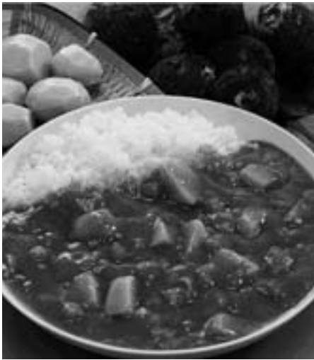
さといもカレー【株サンフーズ】 ～カレーを知り尽くしているからこそ出せる味～

たくさん野菜が入っているので、食べるたびにいろいろな味を楽しむことができます。特に、甘いさといもの味が口いっぱいになり、お年寄りにもやさしい味になっています。 一般的なカレーは、辛いイメージがありますが、このカレーは幼い子どもたちでもおいしく食べられると思います。