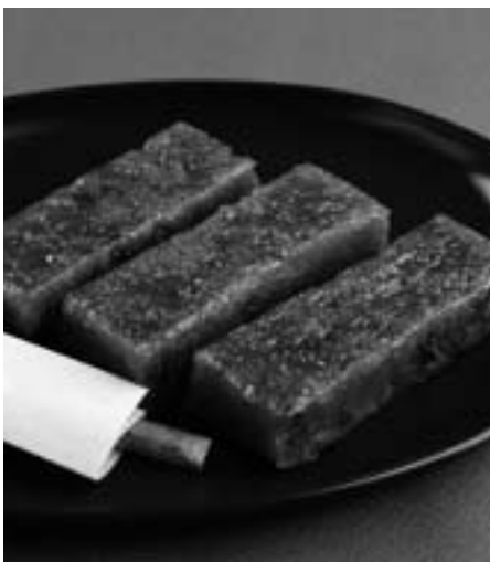
ひとくち生志ぐれ【宥富永松栄堂】 ～昭和天皇皇后ご命の富永松栄堂の志ぐれ～

ちよつと小腹がすいた時に、パツとつまみやすい、女性にピッタリのサイズです。 はんなりとした甘さと、ぎゅっしり詰まったあずきの存在感がたまりません。 上品な甘さとこのサイズは、お抹茶などのお茶うけに合うことうけあい입니다。 機会があればお茶をたてて、この和菓子を食べてみたいと思います。