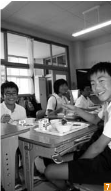
1 給食配送車出発を祝うテープカット 2 最新機器を備えた調理場 3 配送車による給食の配送 4 初めての配膳 5 給食のメニュー 6 7 給食に笑顔を見せる子どもたち 8 この日、空っぽになった食缶 (※4～8は、大和小学校での給食の様子)