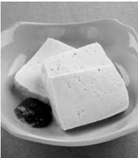
しめとうふ 【有中川食品】 ～南予地方で古くから愛されている伝統食材～

「しめとうふ」は切って置いても通常の豆腐のように水が出ず、油のはねもないので、料理に使いやすい食材だと思います。 また、大豆の香りが控えめで、豆腐があまり好きでない人でも食べやすいのではないかと感じました。 田楽や煮物にも合うと思います。 今回、私は柚子味噌で大変おいしくいただきました。