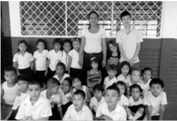
1年生の子どもたちと

学校での活動、友達や近所の人との雑談。こうしたニカラグアでの日常が本当に楽しいです。1日1日を大切にしながら活動していきたいと思えます。