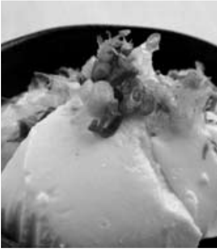
すくいとうふ 【有中川食品】 ～地元産大豆の風味と旨味をご堪能あれ～

普段食べているとうふより大豆の味が濃くて、とてもおいしかったです。口の中に入れると、とろけるような感じのとうふでした。 僕はとうふに何もかけないで食べるのが好きなので、この風味のあるとうふの味がとてもよかったです。 また食べてみたいと思います。