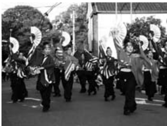
えひめYOSAKOI祭り2012受賞結果

パレード会場の一つとなったアクトピア前には、大勢の観客が詰めかけ、その華麗な演舞に声援と拍手を送っていました。 祭りの受賞結果は、左記のとおりです。