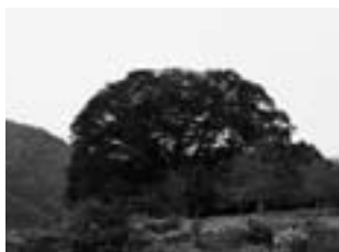
ひろつお 広常のタブノキ 大洲市指定天然記念物 個人所有

肱川町大谷の広常地区にある本樹は、樹高約15m、根回り9m、目通り周4.4mで、幹は地上1.6mのところから8つに分かれ、樹齢は約400年と推定されています。根元には七者権現 ななしごんげん と呼ばれる小さな社 やしろ があり、天正11年（1583）、高尾城が土佐の長曾我部氏 ちようそがべ の軍勢によって攻め落とされた際、ここまで落ち延びて切腹した7人の侍を祭ったものとされています。このため地元では昔よりタブノキを切ると、たたりがあると言い伝えられています。