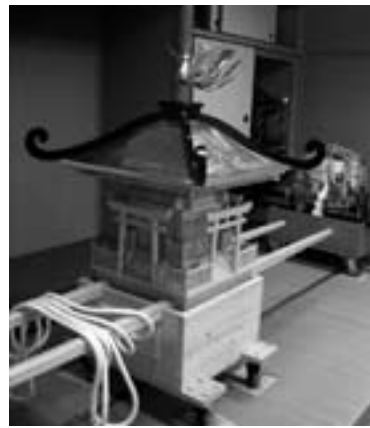
子どもみこし整備事業