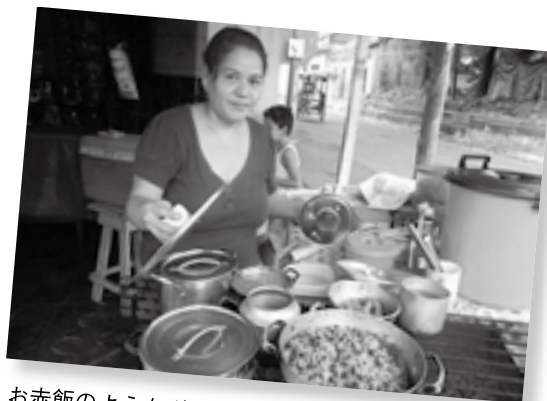
お赤飯のようなガジョピント