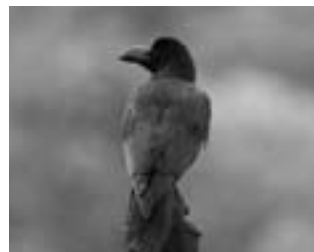
ハシブトガラス （嘴太鳥） スズメ目 カラス科 大きさ56.5cm

童謡にも歌われた澄んだ鳴き声のカラスですが、特徴は分厚いくちばし（ハシブトと言われる由縁）と、でっぴったおでこです。優しいイメージは遠い過去のこと、経済活動が盛んになるにつれ、害鳥扱いにされるようになりました。とても利口な鳥で、体の大きさに対する脳の体積は犬よりも大きく、目は人と比べて8倍も見えているので、空から眺めると、人間様のおぼれを頂戴することくらい、朝飯前と言うところでしょうか。人類が繁栄し、そこで共存する手段を覚えた生き物たちは、大量に繁殖してきたのですが、多くなり過ぎた数をコントロールできるようになれば、ノーベル賞ものだと思います。