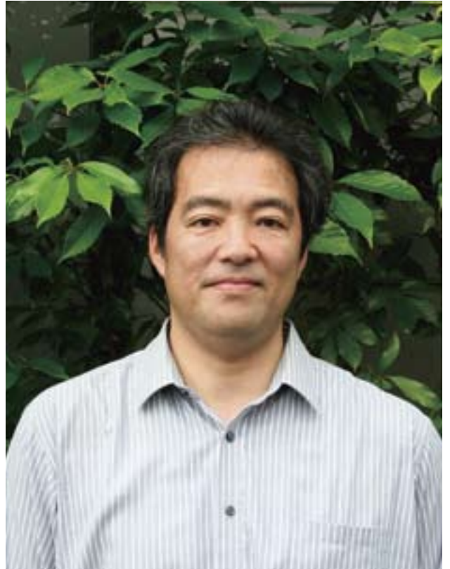
NPO法人おおずスポーツクラブ