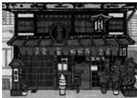
大賞 / 一般の部