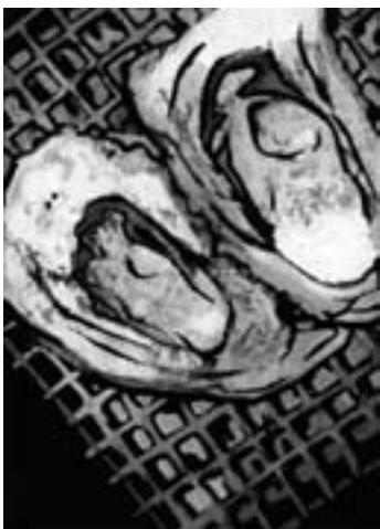
大賞 / 中学生以下の部