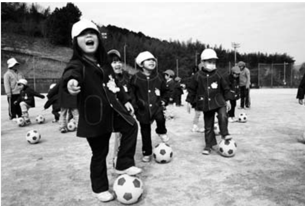
キッズプログラム・プロジェクト（おおずスポーツクラブ）

平成22年3月8日、大洲市独自の施策として、地域づくりのための「初めの一步」を応援するため、「大洲市がんばるひと応援事業補助金交付要綱」が制定されました。この補助金は地域を元気にするために、新しい事業を考えている人を応援し、経済面のハードルを低くして、事業に取り組みやすくするために創設されたものです。平成24年度で3年目を迎える「大洲市がんばるひと応援事業補助金」。地域を明るく元気にしたみなさん、応募してみませんか。今月号では、この補助金を活用した過去の事例を取り上げ、さまざまな分野での地域づくりへの取り組みを紹介します。