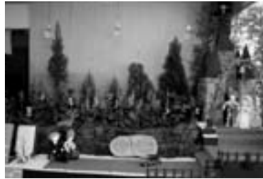
(昨年の展示物「野点」)

また、蘭の花とかわいらしいお人形の造り物、昨年の『野点』に続き、今回は「良寛さんと子どもたち」をテーマに、蘭の花とお人形の素敵なディスプレイを、ぜひお楽しみください。