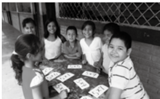
好評?だった九九のゲーム