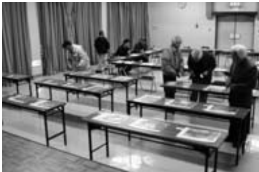
今年も力作がそろいました

大洲市観光協会河辺支部の主催により、3回目となるフォトコンテストが開催されました。今回は、「河辺観光フォトコンテスト」と題し、河辺町内で開催されているイベントや屋根付き橋などの観光施設、自然などの写真を募集しました。県内をはじめ、遠いところでは神奈川県鎌倉市在住の人からも募集があり、野趣あふれる作品が集まりました。