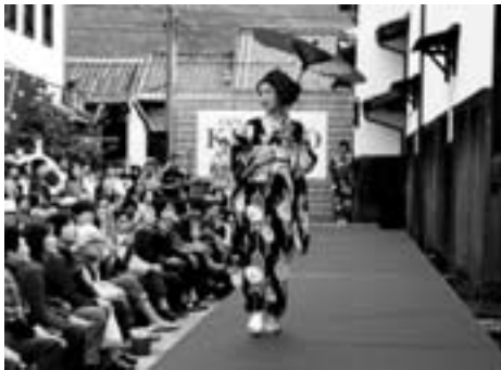
あて 艶やかおはなはん通り ～大洲着物ガールズコレクション～

オオズ☆ロケット団は、30～50代の男女9人で活動しています。私たちの暮らすまち「大洲」を、もっと知ってもらいたい、地域や世代を越えて多くの人とつながり、大洲からいろいろなことを発信したいと考えています。平成23年度は、おはなはん通りでの着物ガールズコレクション、大洲城でのキャンドルナイトなどのイベントを実施しました。