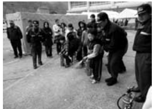
水消火器を体験する子どもたち

雪が降り、大変寒い1日となりましたが、参加したみなさんは真剣に取り組み、災害時の心構えを学んでいました。