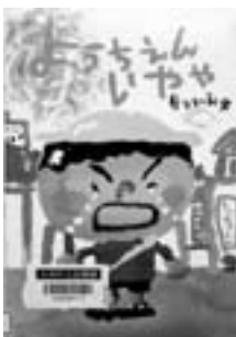
羅針 榎 周平著 出版：文藝春秋

「ようちえんいくの、いやや」今日もだれかが泣いている。たけしくんとまなちゃんをつばさくんが泣いている。理由はいろいろ。でもね、本当は…。幼稚園が大好きになる絵本。