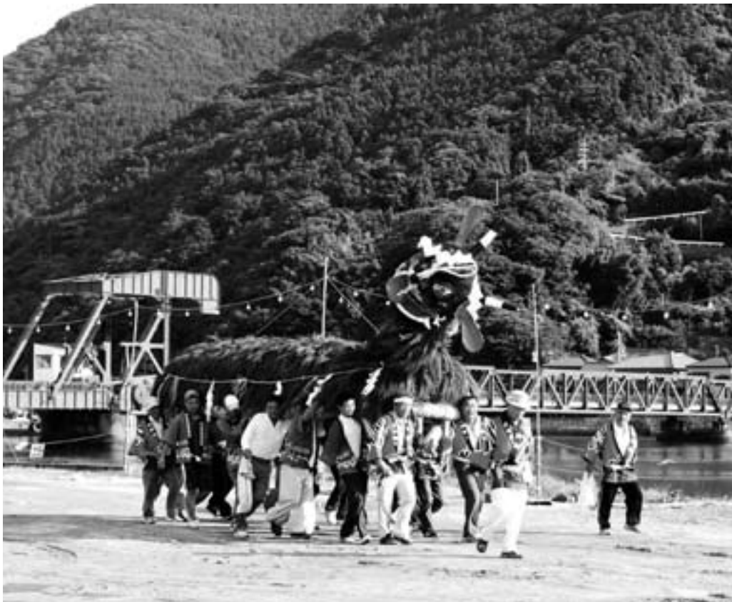
伝統芸能の保存伝承 (愛郷櫛生一団楽) あいきょうくしゅう

「大洲市がんばるひと応援事業補助金」の年度別採択状況は次のとおりとなっております。さまざまな事業に有効活用されました。