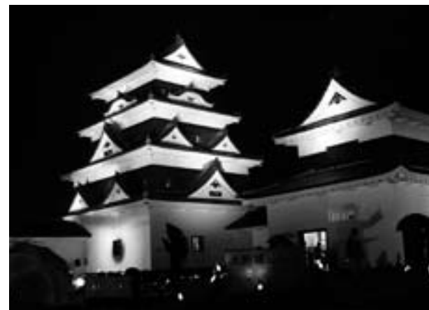
オオズキャンドルナイト（オオズの魔法使い）