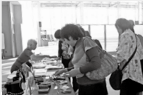
▲展示資料を見る研修参加者

平成7年1月17日発生 震度7 (マグニチュード7.2) 人的被害 死者 6,432人 行方不明者 3人 負傷者 43,792人 住家被害 (全壊、半壊、一部破損) 512,882棟 建物火災 261件 ～阪神・淡路大震災について(第105報) 消防庁災害対策本部から～