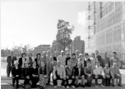
▲人と防災未来センターの防災未来館を見学

人と防災未来センターは、阪神・淡路大震災で起こったことや、子どもたちに伝えなければならないことを見ることのできる施設です。ここでは、災害に強いまちづくり、そして私たち自身の準備に役立つ取組が行われています。防災や減災は国や自治体の取り組み問題にとどまらず、私たち一人ひとりの地