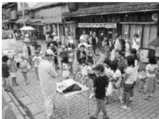
▲この風船で何ができるかな？