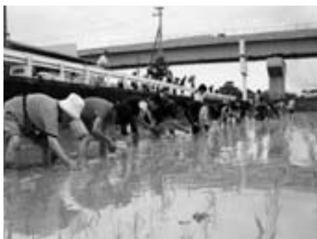
▲田植え体験のようす（6月）