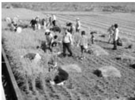
▲稲刈り体験のようす（10月）

愛媛たいき農協と大洲市青年農業者協議会は、毎年6月と10月に、食と農についての理解や関心を深めてもらおうと、東大洲の水田で一般の方を対象に家族米づくり体験を実施し、市内外から毎回約百人の参加があります。 参加した人たちは、田植えや稲刈りを通して、お米がどのようにできるかを田んぼで学び、収穫の喜びを味わうなど、楽しく米づくりを体験しています。また、収穫されたお米は精米され、後日、参加者の皆さんにプレゼントされます。 参加者からは「子どもたちがご飯を残さず食べるようになった」などの感想が寄せられ、米づくりを通して、農業の大切さを肌で感じとっているようでした。 大洲市では今後も、食と農の繋がりを感ずることができ、このような取り組みの支援を続けていきたいと考えています。