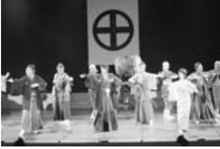
▲軽快な音楽で舞台と客席が一つに

午後2時開演の昼の部では、高校生や一般の人で席が埋まり、ほぼ満席となりました。上演中は、客席から笑い声や拍手が盛んにおこり、軽快な音楽に合わせて手拍子を打つなど、舞台と客席が一体となった、すばらしい公演となりました。終演後は、出演者がホールの外で観客とふれあい、握手や写真を撮る姿が見られました。