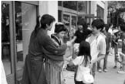
▲主演のお二人と握手