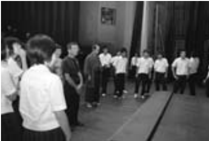
▲本物のセットに興味津津

間見ることができました。午後6時30分開演の夜の部も、会場はほぼ満席となり、夏季大学で初めてのミュージカルは、大盛況でした。