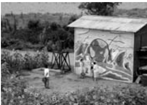
▲五郎「畑の前橋」下、ひまわり畑