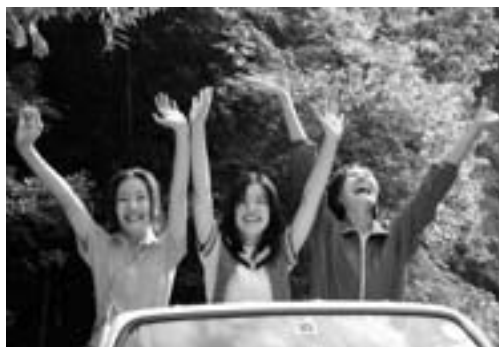
▲肱川町鹿野川湖近く