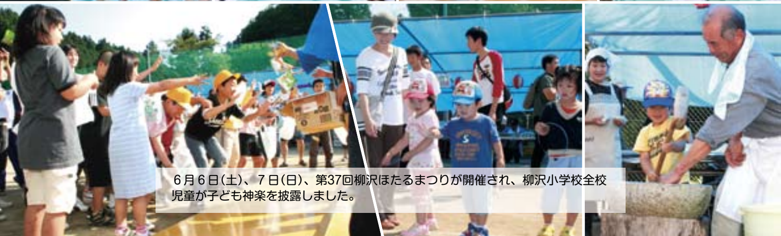
6月6日(土)、7日(日)、第37回柳沢ほたるまつりが開催され、柳沢小学校全校児童が子ども神楽を披露しました。