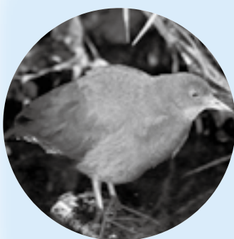
かわうそ復活プロジェクト NPO法人

※昨年からの検診申し込みは実施していません。受診希望の方は、問診票や大腸がん検診容器を検診場所に置いています。検診日までに取りに来られない方は、検診当日会場にて問診票をご記入ください。また大腸がん検診は、容器を検診当日お渡し、後日回収日に持参していただく方法もあります。 ※胃がん検診を受けられる方は、前日の夜10時以降飲食しないでください。(水、タバコも摂取不可) ©大洲市健康づくりリーダー作成による、「大洲市ウォーキングマップ」ができました。各保健センター各連絡所などさらに市のホームページでも紹介していますので、健康づくりにご活用ください。