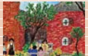
▲小学生高学年の部 最優秀作品