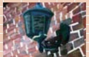
▲中学生の部 最優秀作品