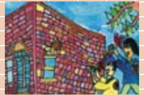
▲小学生低学年の部 最優秀作品