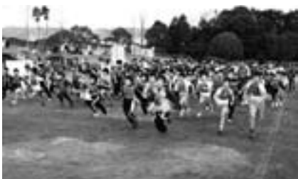
▲一斉にスタートする参加者