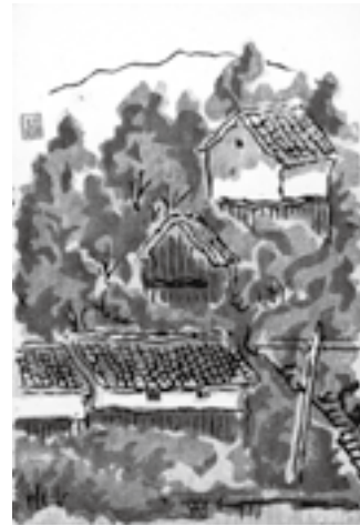
▲一般の部大賞作品