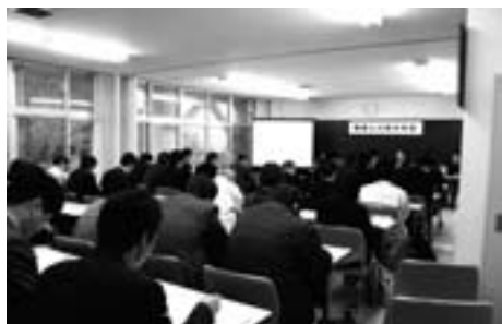
▲職場と行政分科会

大洲青少年交流の家で、平成20年度大洲市人権・同和教育研究大会が、約340人の参加のもと開催されました。 午前9時からの開会行事に続き、午前中は、就学前教育、学校教育、社会教育(第1・第2)、職場と行政の5つの分科会に分かれて、それぞれの報告をもとに熱心に協議が行われました。