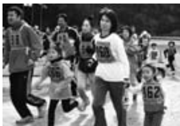
▲微笑ましい光景がたくさんありました

ファミリーコースでは、小学校低学年とは思えないくらい速く走る児童や、手をつないで、和気あいあいと走る親子づれなど、微笑ましい光景が繰り広げられていました。