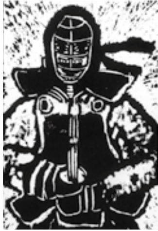
▲中学生以下の部大賞作品

第8回「版画絵はがきコンテスト作品展」が風の博物館で開催されています。このコンテストは、昨年11月から1月末日まで募集していたもので、大洲市内はもとより全国各地から477点（一般の部241点・中学生以下の部236点）の応募がありました。この作品展では応募のあったすべての作品を一挙公開します。はがきサイズいっぱい描かれた木版画やシルクスクリーン、ゴム版画など感性あふれる作品の数々をこの機会にぜひご観覧ください。