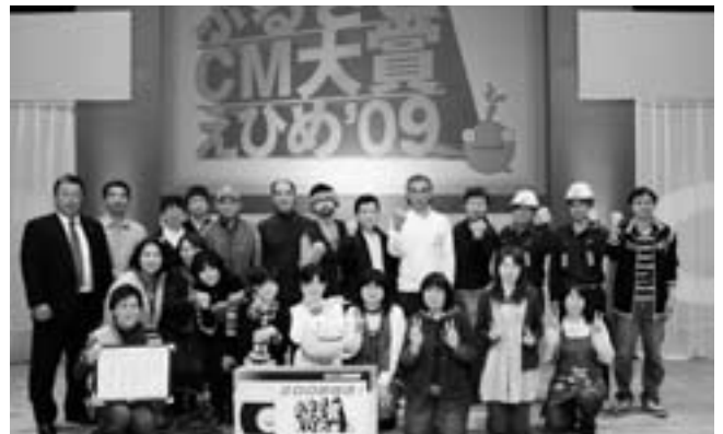
▲見事、2度目のCM大賞を受賞しました