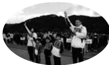
▲仲良く選手宣誓をする内さんファミリー