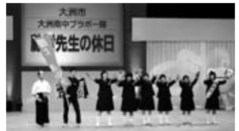
▲南中ブラボー隊!も元気いっぱいのパフォーマンスを披露