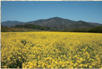
▲昨年の菜の花畑のようす