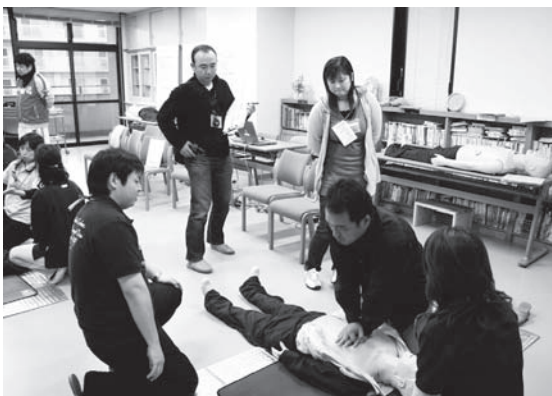
▲真剣に受講する参加者

の講習会でしっかりとスキルを身につけたい」と豊富を語っていました。心肺蘇生の基本である「胸骨圧迫(心臓マッサージ)」の実習では、受講者らは基本の姿勢はもとより、速さ、リズム、深さ(強さ)など、指先まで細心の注意を払いながら、真剣に取り組んでいました。医療に携わるプロのための講習会とあって、急変時が想定された内容となっており、実際の救急医療現場さながらの、真剣さと緊張感がみなぎっていました。