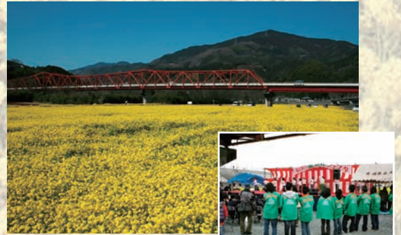
▲昨年の菜の花畑のようす