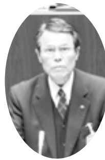
市長の議案提案内容(要旨)

平成20年第5回大洲市議会定例会が、12月3日(水)から16日(火)までの14日間の会期で開かれました。今回の議会では、平成20年度大洲市一般会計補正予算などの予算関係8件、大洲市図書館条例及び大洲市視聴覚センター条例の一部改正などの条例関係8件、人事案件1件、大洲市公共下水道根幹的施設の建設工事委託に関する基本協定の変更などその他7件のあわせて24議案がいずれも原案のとおり可決、承認され、また請願3件が審議されました。