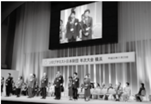
▲横浜市での表彰式の様子