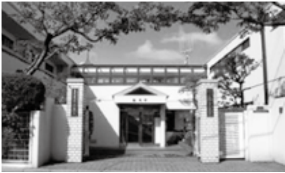
▲正面からみた「肱水舎」

東京都三鷹市にある男子学生寮「肱水舎」(叶幸夫理事長)の3か月間にわたる改修工事が完了し、9月にリニューアルしました。「肱水舎」は、1901年に旧大洲藩藩主の加藤泰秋公が東京下谷に創設し、荻窪と三鷹への移築を経て今年で創設107年を迎えました。「肱水舎」では、大洲市内