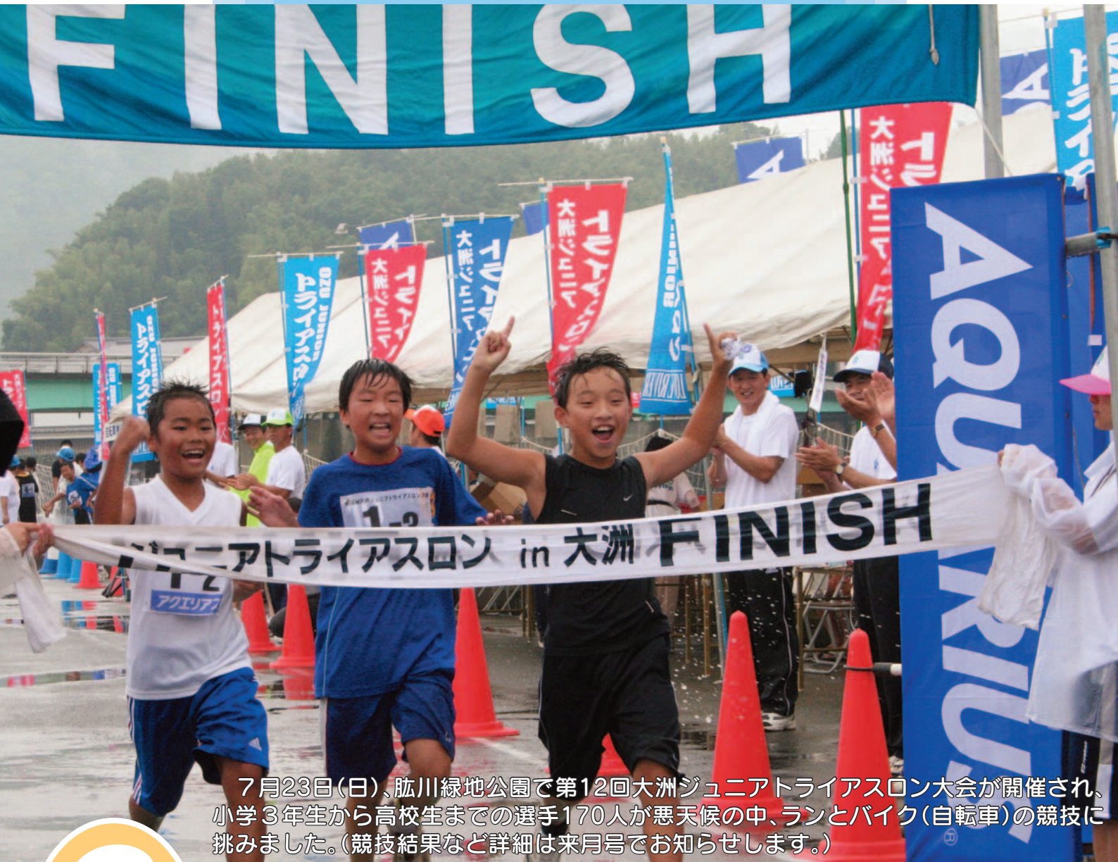
7月23日(日)、肱川緑地公園で第12回大洲ジュニアトライアスロン大会が開催され、小学3年生から高校生までの選手170人が悪天候の中、ランとバイク(自転車)の競技に挑みました。(競技結果など詳細は来月号でお知らせします。)