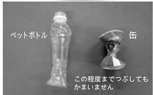
この程度までつぶしてもかまいません

※ペットボトルのはがれたラベルは、もやすごみとして出してください。 ※中間処理(圧縮)の関係上、足で踏みつぶしたり、器具を使用してつぶしたりはしないでください。 ※肱川、河辺地区の皆さんは、缶の指定ごみ袋がありませんので、従来どおりつぶさずに出してください。(ペットボトルはつぶしてかまいません。) ※ごみは決められた日に、必ず分別して出してください。