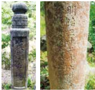
藤雲橋的主柱(山莊側)

當時的報紙新聞報導中描述為「架設一座藤蔓翠綠的橋」，因此可知這是一座有藤蔓纏繞裝飾的橋。現在藤雲橋周圍仍有藤蔓生長，是那遙遠過往留下的紀念。