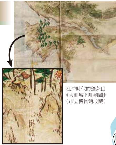
江戶時代的蓬萊山 《大洲城下町割圖》