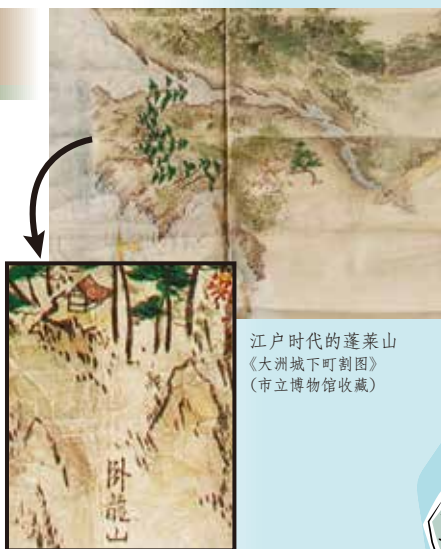
江户时代的蓬莱山 《大洲城下町割图》 (市立博物馆收藏)