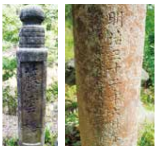
藤云桥的主柱(山庄侧)

当时的报纸新闻报道中描述为“架设一座藤蔓翠绿的桥”，因此可知这是一座有藤蔓缠绕装饰的桥。现在藤云桥周围仍有藤蔓生长，是那遥远过往留下的纪念。