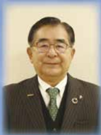
大洲市長 二宮 隆久