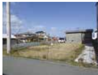
物件番号1-001 (長浜甲675番6)