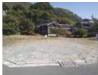
物件番号1-008 (長浜町上老松5番1)