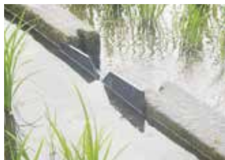
田んぼダムの実証実験を行いました。