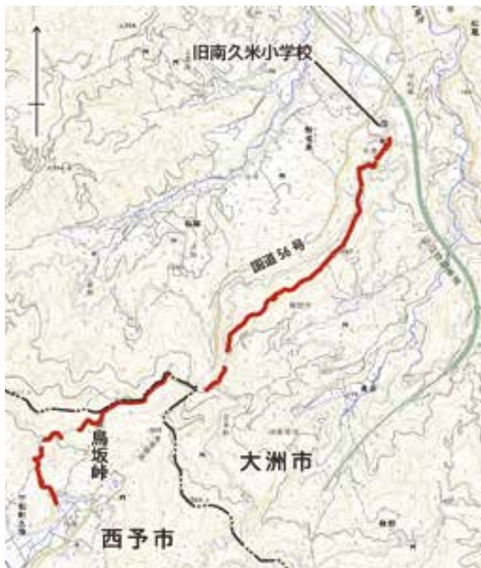
史跡指定予定の範囲 (地理院地図を加工して掲載)

※なお、一部で崩落などが生じ、現在は通行が難しい地点がありますので、見学や通行の際は十分にご注意ください。