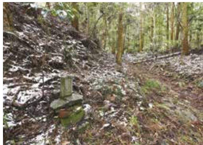
道沿いに残された遍路墓のひとつ