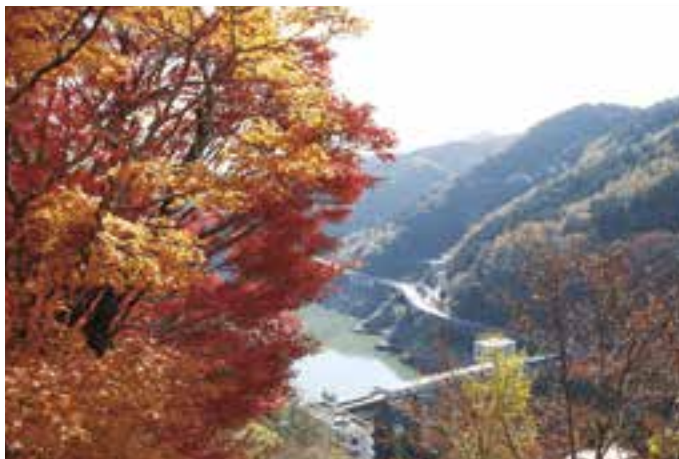
鹿野川園地からの眺め (11月23日(木)撮影)