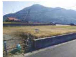
物件番号1-009 (長浜町上老松13番1)