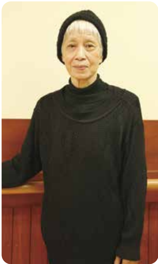
介護予防サークル「ころばれん」