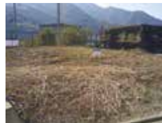
物件番号1-005 (長浜町上老松2番1)