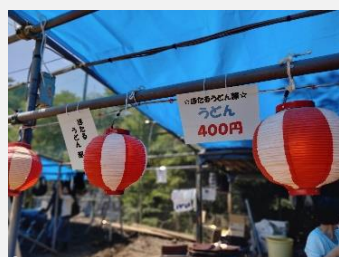
柳沢ほたるまつり