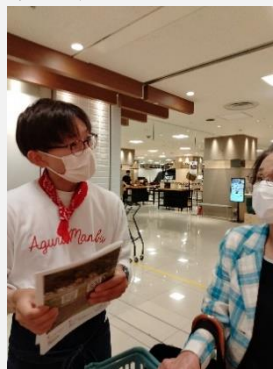
内子晴れ朝食会に参加