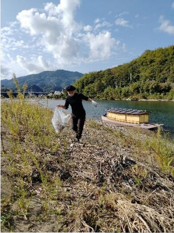
肱南地区でごみ拾い