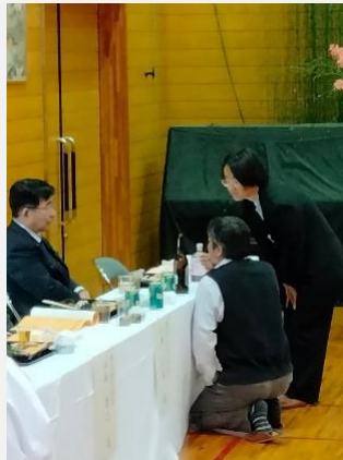
敬老会にて 地域の方と市長に挨拶