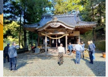
地域行事にはできる 限り顔を出します