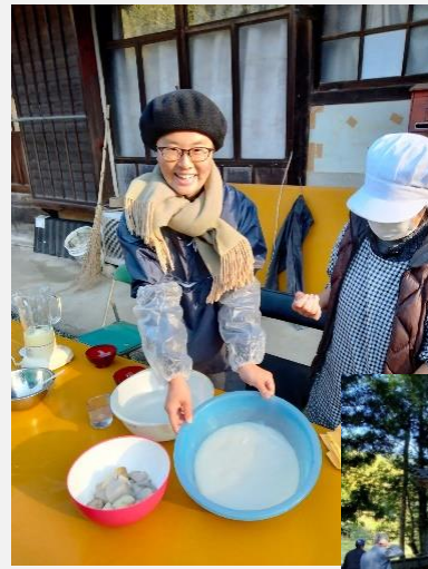
地域の方に誘われて こんにゃくづくり