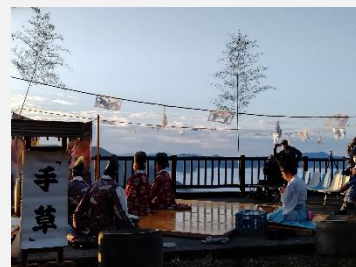
雲海まつりに参加