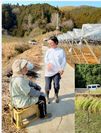
地域の方と 作業の合間におしゃべり