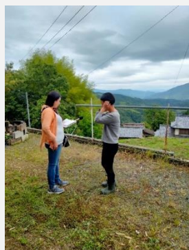
南海放送ラジオ生中継前の打ち合わせ