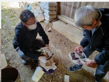
大家さんと写真の整理