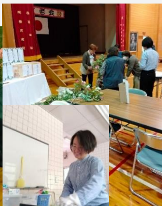
田処活性化センター大掃除