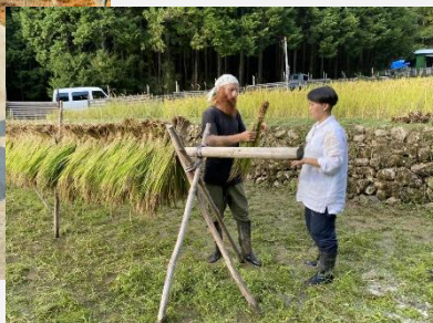
西予市おめぐり案にて研修