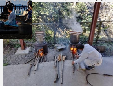
お餅つきのお手伝い