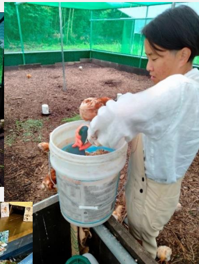
大磯町の養鶏農家を訪問