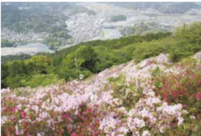
富士山のつつじ (令和3年4月23日(金)撮影)