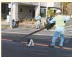
3月12日(土)16:00頃 肱川橋北側の作業風景

3月12日(土)、新しい肱川橋が開通。16時に路面に貼った白線や黒テープが剥がされると新しい車線が現れ、わずか数分間で交通切り替えが行われました。段取りの良さに感銘を受けました。今月号が最後の編集となりました。広報担当になって撮影した写真は数万枚。取材を通じて大洲の魅力を変えて感じた1年でした。広報おおず作成にご協力いただいたすべてのみなさんに心から感謝を申し上げます。