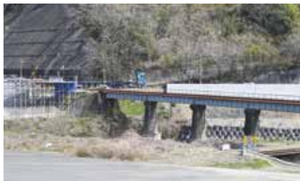
JR橋梁区間 現地状況 3月時点