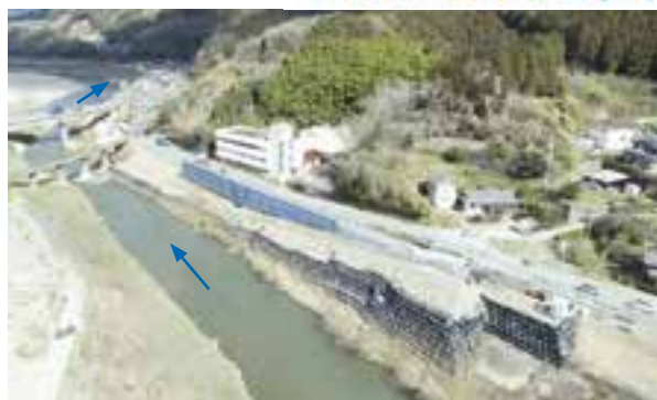
小貝地区 現地状況 3月時点