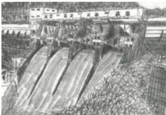
《大賞》中学生以下の部「鹿野川ダム」ドライポイント