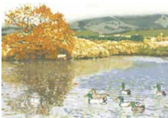
《大賞》一般の部「晩秋の久住高原」多版多色木版画