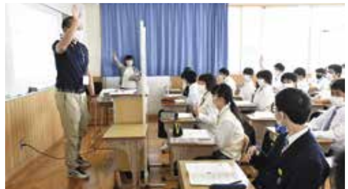
地域探究プログラム・オリエンテーション

長浜高校は、水族館部のカクレクマノミやクラゲの研究が有名ですが、実は地域研究にも熱心に取り組んでいます。今年2月には、高校生が主体となった地域づくりを表彰する「えひめ地域づくりアワード・ユース2019」にて、応募のあった30団体から5団体の最終審査に進み、プレゼンテーション審査の結果、見事最優秀賞を獲得しました。また今年度からは、文部科学省所管の国立青少年教育振興機構が主催する「地域