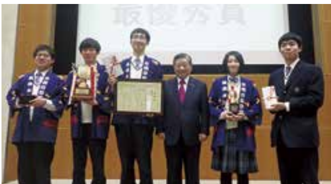
えひめ地域づくりアワード・ユース2019

探究プログラム」実施校に選定されました。国立大洲青少年交流の家の指導を受けながら、生徒が長浜地域の抱える課題を発見し、その解決方法を考え、解決のための取り組みを実践します。来年1月には、四国地区審査会を兼ねた研究発表会を本校で開催し、代表1チームが東京で開催される全国大会に出場する予定です。生徒が地域でアンケート調査などを実施している際には、皆様のご協力を頂ければ幸いです。