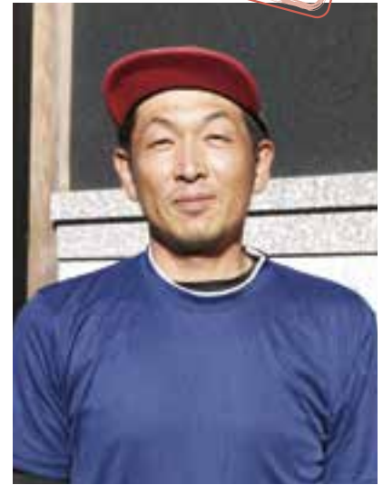
瀧本左官 (八多喜町甲1258番地1)