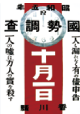
第3回国勢調査のポスター 昭和5年(1930)