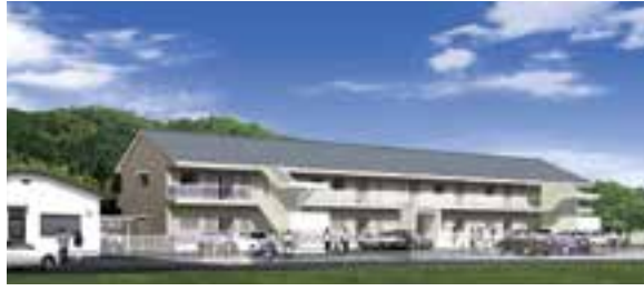
災害公営住宅(森団地)完成予想図