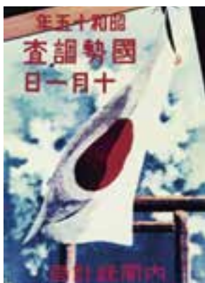
第5回国勢調査のポスター 昭和15年(1940)