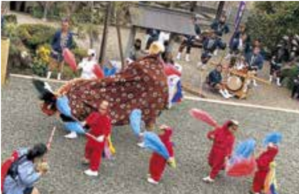
【村島地区地方祭の様子】

本制度の活用により、地域活性 化に向けた活動の早期再開が可能 となり、地域コミュニティの維持 に繋げることができました。