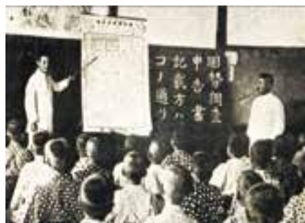
第1回国勢調査の申告書の書き方 大正9年(1920)

査の行われた10月1日午前零時には、各地でサイレン、大砲が鳴り、お寺やお宮では鐘、太鼓を鳴らし、文字どおり鳴り物入りのお祭り騒ぎで、国を挙げた一大行事でした。100年目の国勢調査は、今年10月に実施されます。みなさんのご協力をお願いします。