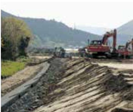
【菅田地区での築堤工事の様子】