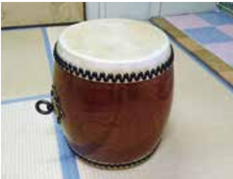
獅子舞備品整備事業 (中村青年団)