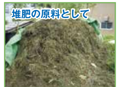
堆肥の原料として