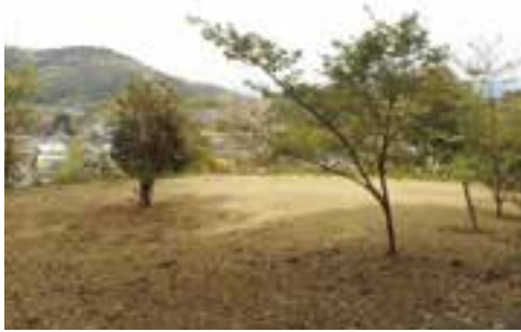
土肥ふれあい公園整備事業 (土肥地区自治会)